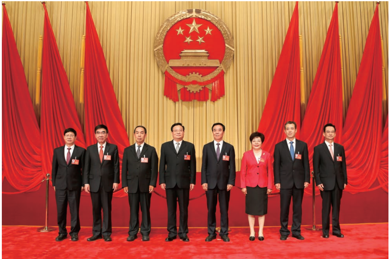
▲ 自治区人大常委会领导班子合影。