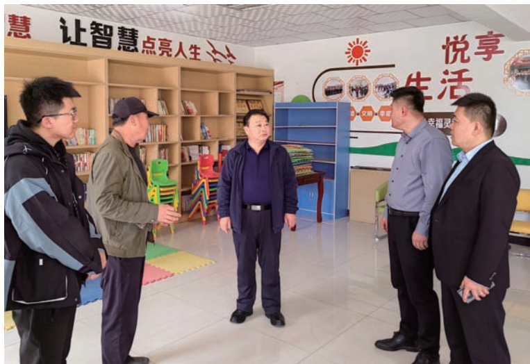
▲ 灵武市人大常委会调研组调研郝家桥镇农村基层治理工作。

握法律，建立会前学法制度，组织常委会委员、人大代表认真学习与人大及其常委会行使职权相关的法律法规。制定 2022 年度普法依法治理工作要点及“四清单一办法”，认真落实普法工作责任。打造“人大书屋”，建立图书管理借阅制度，新购新修订组织法、《习近平法治思想学习纲要》等书籍，提高人大代表和人大工作人员法律素养和工作水平，建设善于学习、勤于思考、敢于创新的人大常委会机关干部队伍。