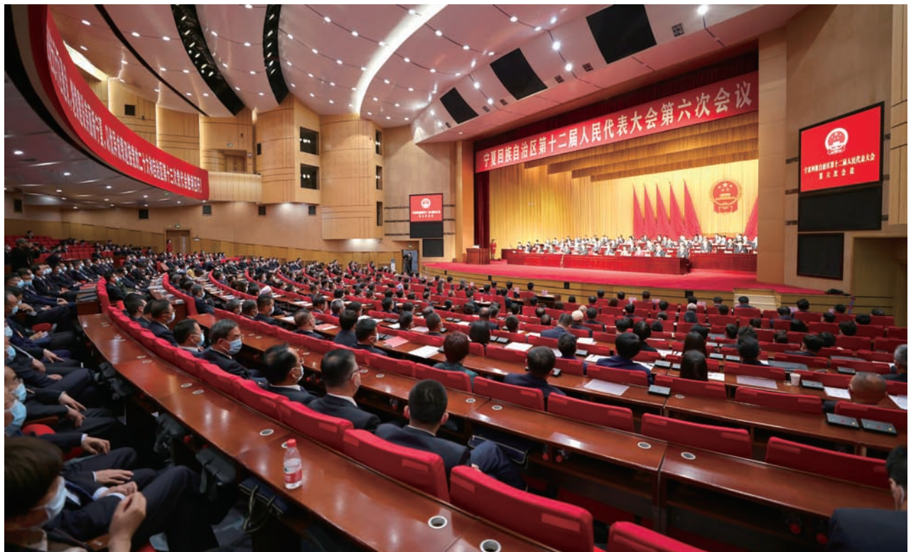
▲ 5月20日至21日，自治区第十二届人民代表大会第六次会议在银川胜利召开。