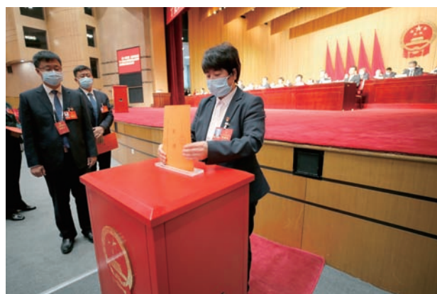
▲ 人大代表投出神圣一票。