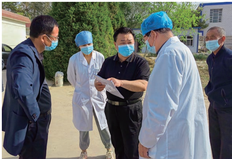
▲ 灵武市人大常委会调研组调研灵武市中医药发展工作。

设经费列入财政预算，保障代表履职经费。完善代表组织体系建设，将四级人大代表按照原选区混编进代表小组，推选小组长，明确联络员，确保代表倾听民情有渠道、反映民意有重点、有作为、有保证。