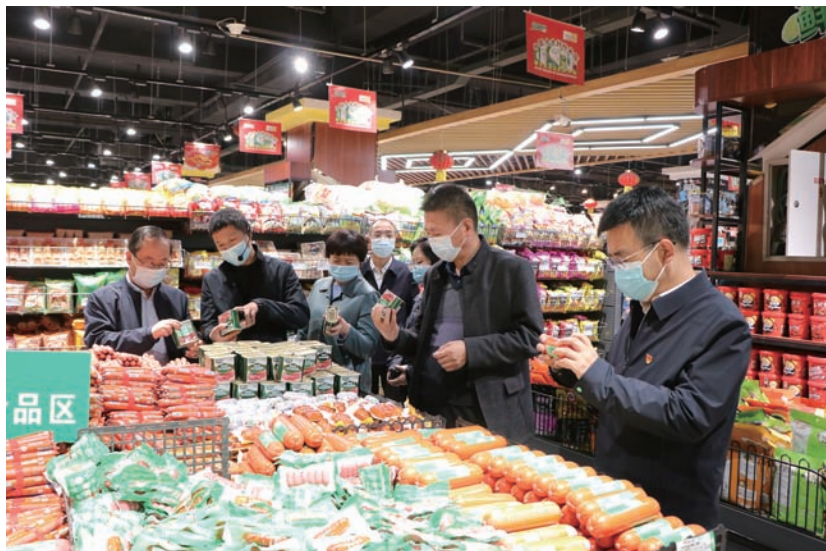
▲ 固原市人大常委会对食品安全法贯彻实施情况进行检查。

聚焦监督工作开展过程中的难点、堵点、弱点，以优化监督方式、增强监督实效为导向，坚持事前、事中、事后全过程监督，努力让人大监督严起来、实起来、作用发挥出来。一是在事前准备上下功夫。每次调研、视察、检查前，就监督的目的要求、步骤方法、时间安排等进行周密考虑，形成有针对性、操作性的工作方案，做到有的放矢。提前组织调研（视察、检查）组成员