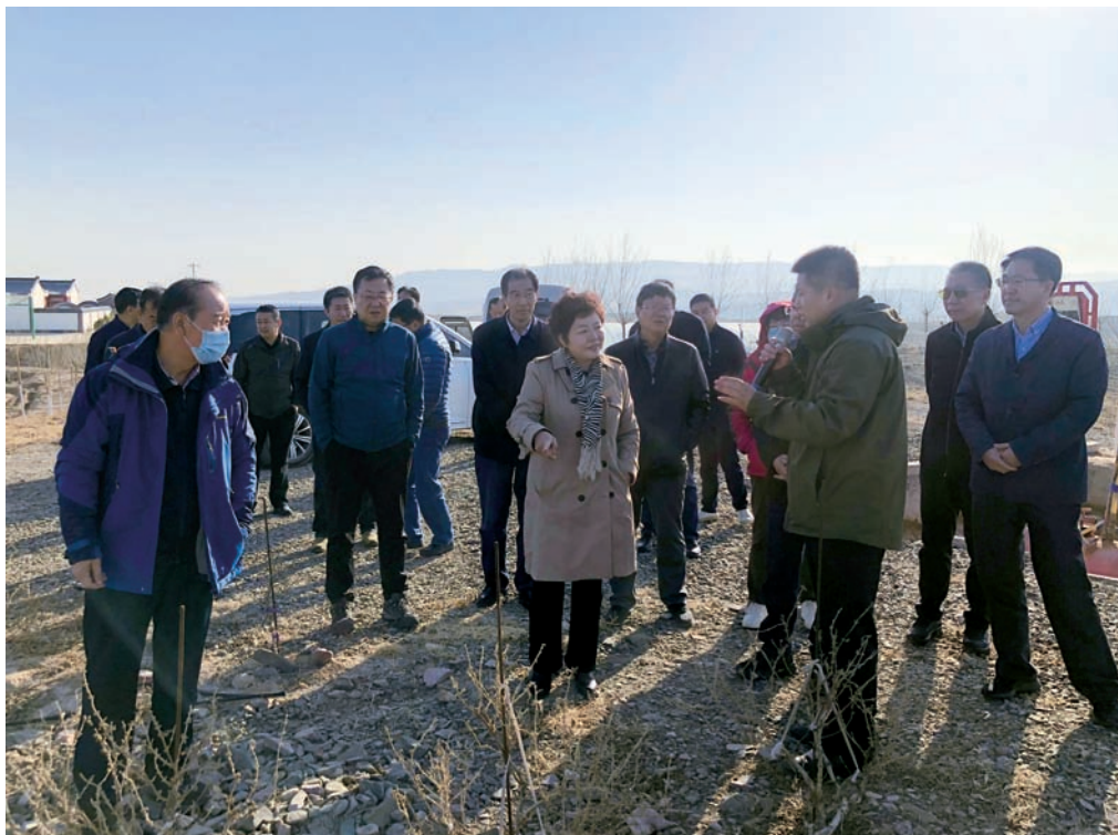
▲ 自治区人大常委会执法检查组深入中卫市沙坡头区兴仁镇检查水土保持情况