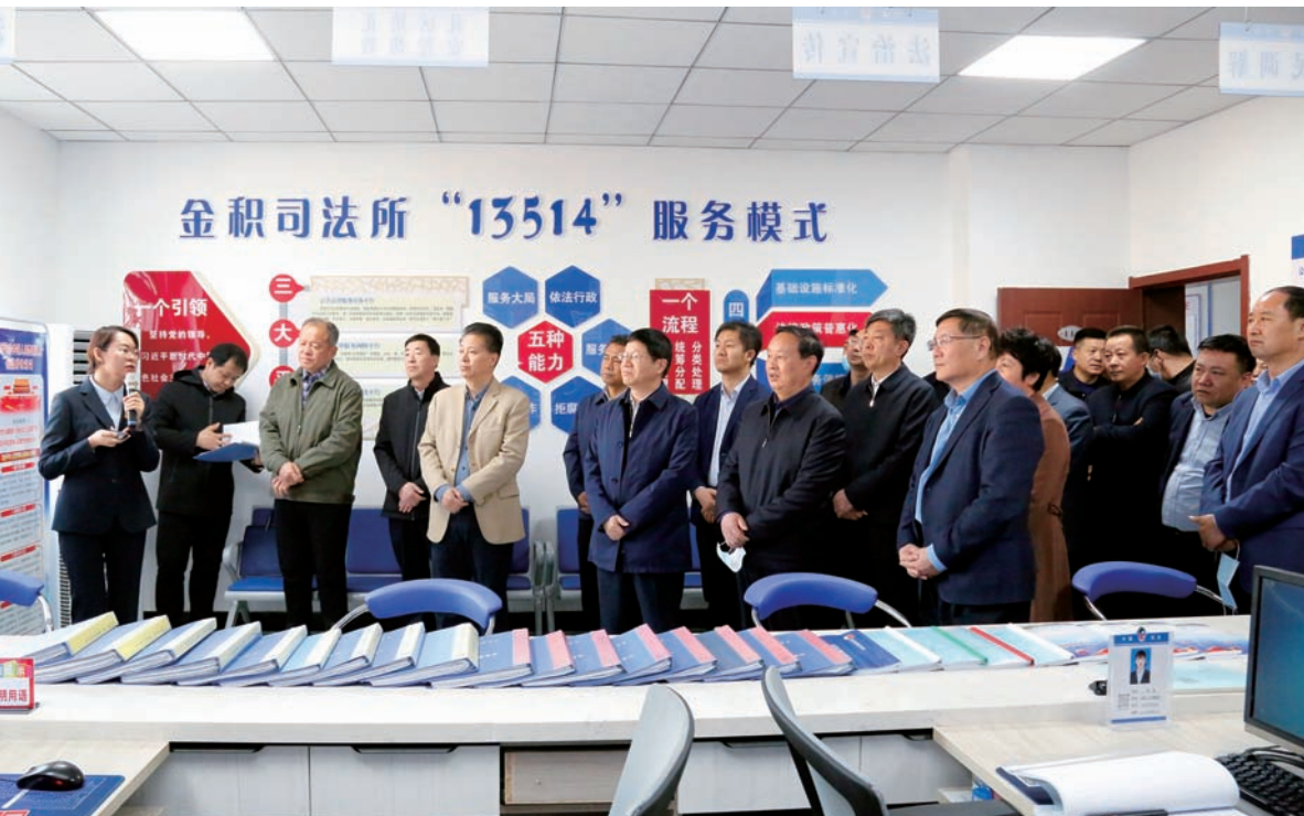
自治区人大常委会执法检查组在吴忠市利通区金积司法所检查社区矫正贯彻执行情况