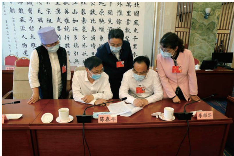
▲ 代表们讨论议案建议