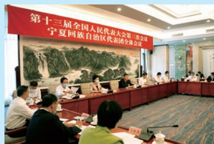
P16 在危机中育新机 于变局中开新局