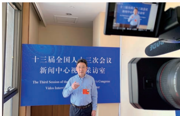
全国人大代表接受视频采访