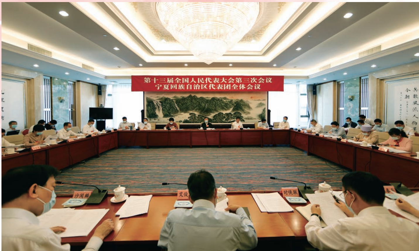
宁夏代表团审议现场