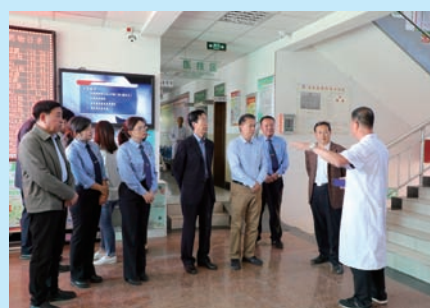
P41 “回头看”+《决定》:助力公益诉讼“亮剑”

声 明 本刊采用了一些文章、图片,因作者地址和联系方式不详,敬请作者与编辑部联系领取稿酬。