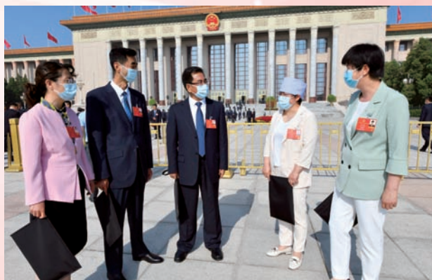
全国人大代表热议政府工作报告