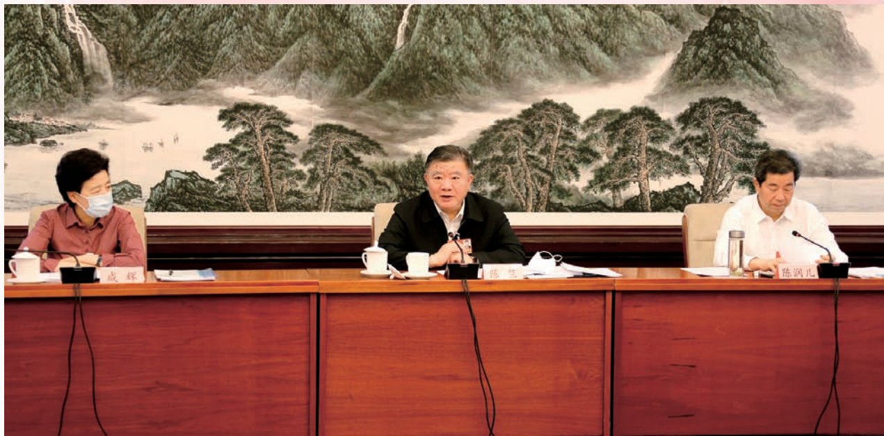
全国人大代表、全国人大常委会副委员长陈竺(中)审议发言