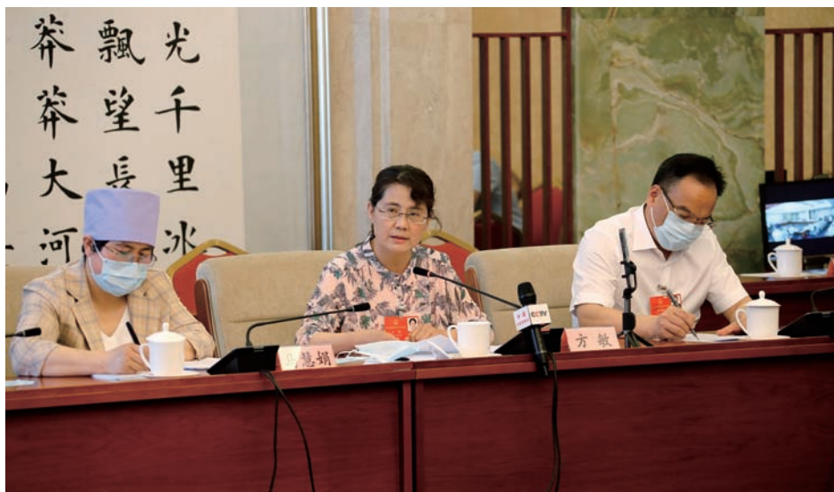
▲ 审议人大常委会工作报告

全年举行6次宪法宣誓仪式,召开第六个国家宪法日座谈会、纪念澳门特别行政区基本法实施20周年座谈会,增强公民宪法观念、带动宪法宣传、促进宪法落实。