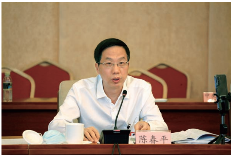
▲ 审议人大常委会工作报告

全国人大代表、中央纪委中央巡视组副部级巡视专员许传智建议,民法典通过后,应及时督促最高人民法院对民法典各编涉及到的有关司法解释进行全面清理,使司法解释与民法典规定相一致。同时,将民法典的宣传作为“七五”普法重要任务进行专门安排部署,在全社会营造爱法守法护法的良好法治氛围。