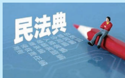
P20 民法典里的“民”与“法”