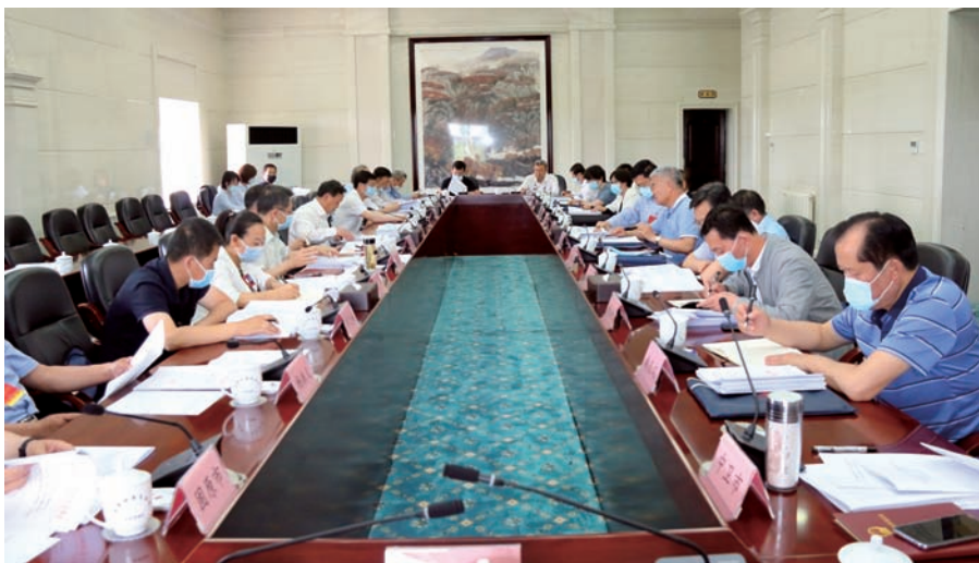
▲ 常委会会议分组审议

2018年以来，为了支持和推进我区公益诉讼工作的深入开展，自治区人大常委会两次听取了自治区人民检察院关于公益诉讼工作开展情况的报告。