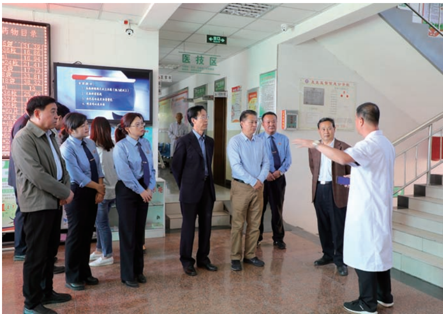
▲ 在中宁县调研检察机关公益诉讼工作

报告客观回顾了我区五大领域公益诉讼工作开展情况,总结了五个方面的有效做法,实事求是地分析了存在的问题,提出的措施切实可行。