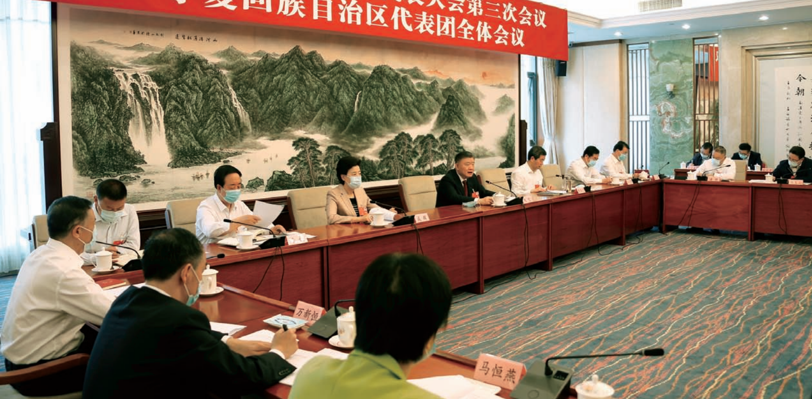
▲ 宁夏代表团审议现场