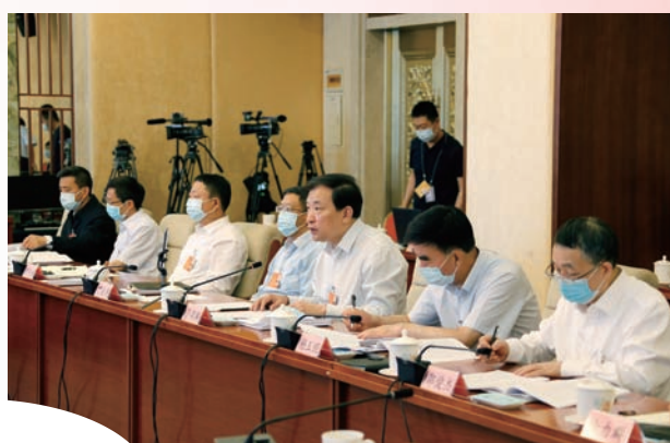
与会全国人大代表 审议发言