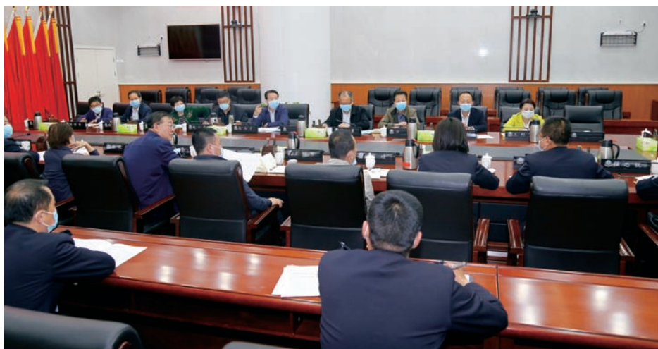
▲ 自治区人大常委会执法检查组召开座谈会

“我局深入推进‘放管服’改革,认真落实国家‘只跑一次’‘全国通办’新政,推广‘一窗受理、在线预约、自助办理、双向速递、延时服务’等业务办理模式,提高服务精细化水平,进一步优化便民服务措施……”在银川市公安局出入境管理局窗口,检