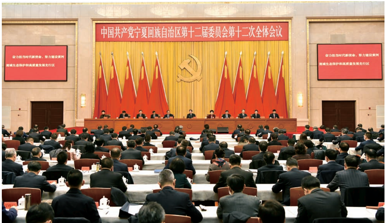
▲ 2020年12月6日至7日,中国共产党宁夏回族自治区第十二届委员会第十二次全体会议在银川举行。全会由自治区党委常委会主持,自治区党委书记、人大常委会主任陈润儿作了讲话。