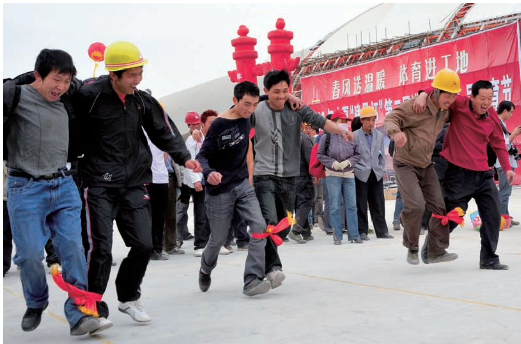
▲ 进城务工人员 在运动会上参加双人绑腿跑比赛

“我们将地下车库改造成了党群文化活动中心,车库顶改造成了室外羽毛球场、轮滑场、篮球场,将废弃的自行车棚改建成舞蹈室。活动场地及体育设施全天免费向居民开放,辖区居民出门就能