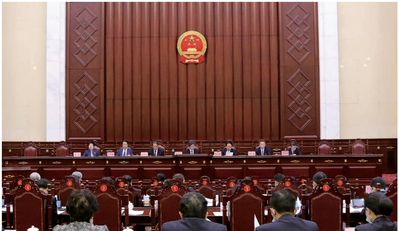
▲ 2020年11月23日至25日,自治区十二届人大常委会第二十三次会议在银川召开。自治区党委书记、人大常委会主任陈润儿主持会议并讲话,自治区人大常委会副主任李锐、姚爱兴、左军、吴玉才、彭友东、董玲出席会议。