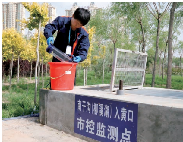
▲ 工作人员进行水质监测

污染源监督性监测能力建设。为有效提升水环境质量监测数据的真实性、准确性、权威性,全面掌握全区水环境质量状况及其变化趋势,按照国家和自治区生态环境监测网络建设方案和环境质量监测事权上收实施方案等要求,着力构建全区水环境质量监测网络体系,研究制定并公布了《宁夏水环境质量监测断面(点位)设置名录》,并按照“省级考核,省级监测”原则,上收环境质量监测事权,对116个断面实施“采测分离”模式。同时,为认真做好市县界断面交水、断面监测、断面考核,加强水环境监测预警等工作,狠抓水质自动监测站建设等项目实施,全区在具备建站条件的黄河干支流、重点湖库、地表型集中式饮用水源地、重点入黄排水沟,已建在建水质自动监测站55个(目前已基本建成35个)。