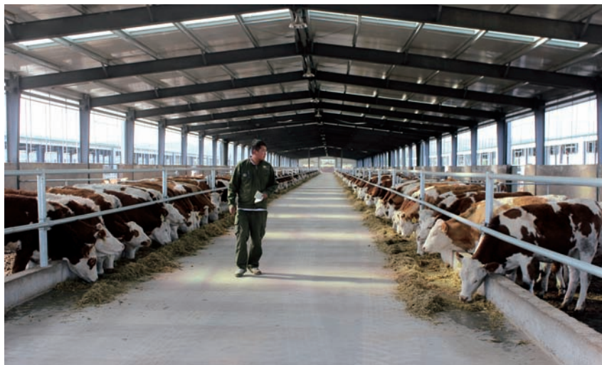
▲ 肉牛养殖助力老百姓脱贫致富

扶贫开发采取的主要措施和成效、扶贫对象精准识别和建档立卡情况、扶贫开发项目管理和资金使用等情况。