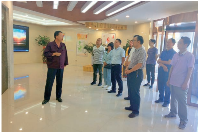
▲ 调研企业人才引进情况

切实强化代表履职服务。常委会把保障和服务代表履职作为工作重点,代表履职有需要,服务保障就跟进。针对代表提升素能的要求,结合贯彻党的十九大精神,邀请人大工作方面的权威专家,围绕新时代人大代表履职主题,对300多名市、县人大代表和40