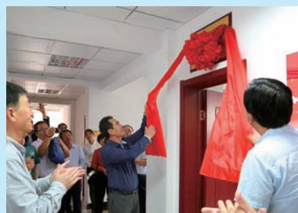
P39 全区乡镇人大工作现状分析及对策