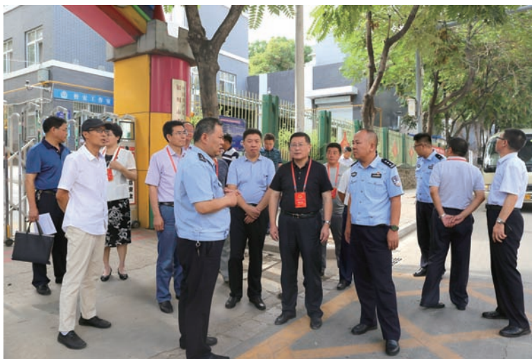
▲ 视察停车场规划建设管理和交通标志标识设置工作

助力经济发展提质增效。围绕改革发展和计划执行,对重点项目建设、重大水利工程、现代物流、科技