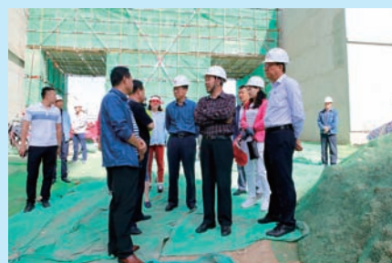
P16 为建设美丽新宁夏加一把力