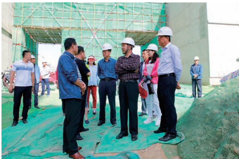
▲ 自治区人大常委会视察组在固原市原州区城隍庙片区了解建筑工地扬尘防治情况

加强生态环境保护依法推动打好污染防治攻坚战的决定》。要求各级人大及其常委会作为国家权力机关,肩负起贯彻落实党中央关于生态文明建设的决策部署、推动生态环境保护法律制度全面有效实施的光荣使命,充分发挥人民代表大会制度的特点和优势,履行宪法法律赋予的职责,主动担当、积极作为,以法律武器治理污染,用法治力量保护生态环境。9月,自治区党委召开全区生态环境保护大会,出台了《关于全面加强生态环境保护坚决打好污染防治攻坚战的实施意见》,对加快实施生态立区战略,坚决打好蓝天、碧水、净土“三大保卫战”进行了再部署再安排再动员。