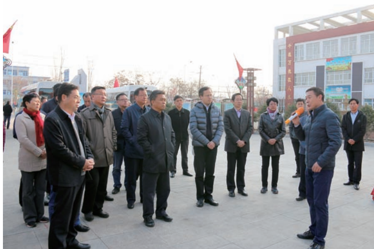
▲ 视察市人民政府 2018 年十件民生实事办理情况

“市政府下一步如何加强食品安全监管？如何加强餐厨垃圾的收集利用？如何应对和破解小作坊、小