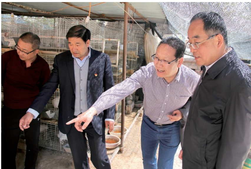
▲ 兴庆区人大常委会调研脱贫攻坚工作

要立足形成合力促进工作。 监督权是法律赋予各级人大及其常委会的重要职权,其生命力在于实效,推动问题的解决。地方人大及其常委会要坚持把监督“一府一委两院”工作同支持他们依法履行职责有机统一起来,寓支持于监督之中,形成加强和推动工作的合力。开展专题询问,一定要切中要害、精准发力、立足于问,达到“三促一宣”的目的。一是促提高认识。地方人大及其常委会开展专题询问其中一个目的,就是要促进监督对象对询问的专题重视程度再提高,认识深度更深入。兴庆区人大常委会开展这次专题询