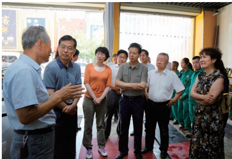
▲ 自治区人大常委会调研组在金凤区福娃洗车行了解残疾人就业情况

听取审议计划、预算执行情况和审计工作报告,听取审议“十三五”规划纲要实施中期评估报告、外事工作情况等报告,推进“十三五”规划纲要深入实施和各项任务如期完成,就进一步扩大开放、防范金融风险、破解瓶颈制约等突出问题,提出有针对性的