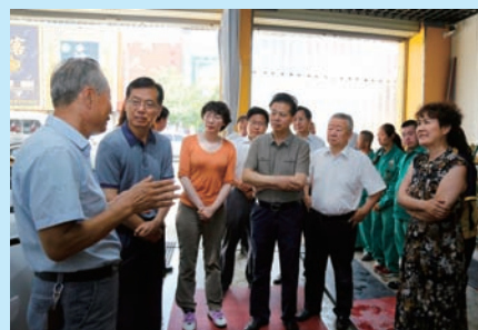
P06 自治区人大常委会 2018 年工作回眸