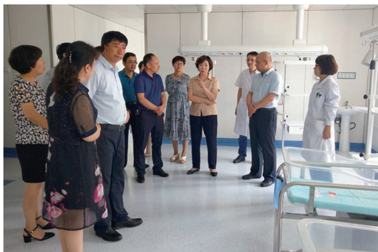
▲ 调研市人民医院医改工作情况

制度，首次听取审议了市人民政府 2017 年度国有资产管理情况报告，推动提升国有资产监管能力，确保国有资产保值增值。