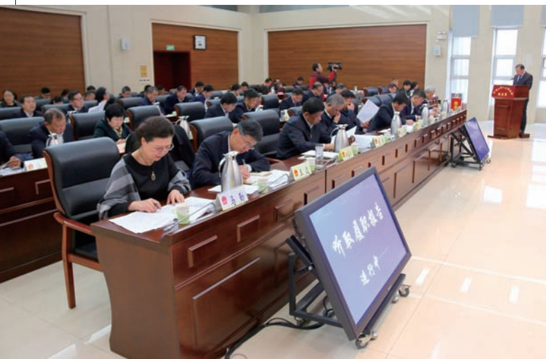
▲ 听取政府部门主要负责人履职报告，并进行评议和满意度测评

环境保护任重道远，让石嘴山天更蓝、地更绿、水更清，是全市人民的期盼，也是人大工作的着力点和奋斗目标。