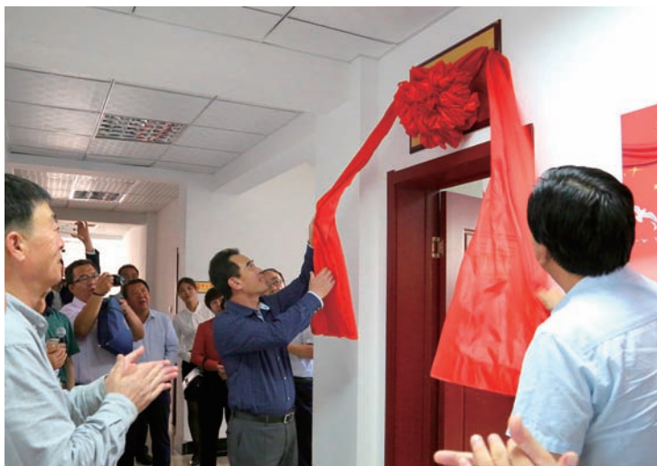
▲ 吴忠市利通区金星镇人大代表之家揭牌

用,合理编成代表小组,以“双联”活动为抓手,认真组织闭会期间的活动,取得了较好的成效。一是通过县乡联合培训、分片培训、观摩交流等方式,强化代表培训工作,着力提高代表的履职能力,提升代表履职的积极性。使每一名代表明确自己的权力和义务,知道如何正确履职。人大主席团成员和代表审议会议议题的能力水平和提出议案建议的质量有了明显提高;二是对代表的履职监督评价机制基本形成。“人民选我当代表,我当代表为人民”已形成共识,各地普遍建立了代表履职档案,开展代表向原选区选民报告履职情况,选民评议代表履职情况的活动,进一步强化了代表履职的自觉性;三是议案建议办理质量有了明显提高。有关国家机关认真履行法定职责,高度重视议案建议办理工作。不断创新办理方式,加强与代表的沟通联络,议案建议办理质量逐年提高,极大地推动了一些基层人民群众关注的热点难点问题的解决。