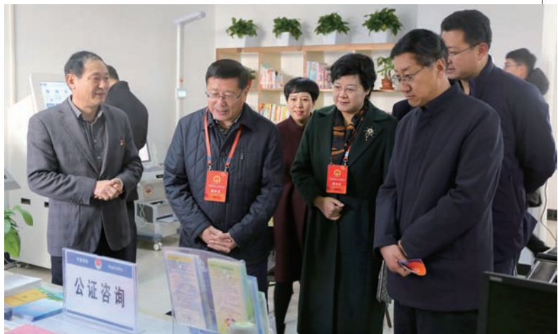
▲ 检查“七五”普法决议落实情况

坚持在行动上发挥党组作用。市人大常委会党组始终强化政治领导责任，召开党组会议 12 次，研究落实主体责任制、意识形态、民族观宗教观、重大立法、重要监督、人事任免、反“四风”、机关党建等事项，充分发挥把方向、管大局、保落实的作用。完善机构建设，增设机关党组，落实管党治党的“严要求”，提升机关党组织的战斗力。党组主动担责、履职尽责，只要是有利于银川发展的，就做到没有障碍、没有杂音；只要